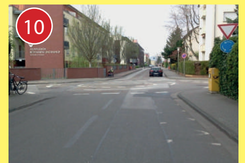
10 Heinrich-Fuchs-Straße/Kolbenzell: Fahre an diesem Kreisverkehr besonders vorsichtig und achte auf die Autos, da hier oft zu schnell gefahren wird und die Autofahrer nicht immer auf die Radfahrer achten.