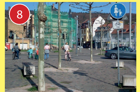
8 Den Rohrbacher Markt nach Möglichkeit vermeiden und alternative Routen nutzen. Die Ampelschaltungen sind hier ungünstig und es kann zu Konflikten mit Fußgängern kommen.