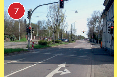
7 An dieser Stelle muss das Rad an der Ampel über die Karlsruher Straße geschoben werden.