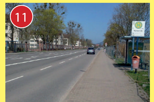
11 Auf der Römerstraße dürfen Radfahrer den Gehweg benutzen. Bitte an den Haltestellen und Ampel langsam und besonders vorsichtig fahren und auf wartende Fahrgäste und Fußgänger achten.