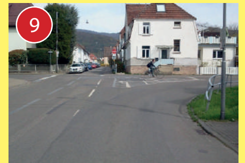
9 Die Kreuzung Kolbenzell/Max-Joseph-Straße ist sehr unübersichtlich. Insbesondere, wenn hier viel Verkehr ist, besonders vorsichtig fahren und den Verkehr aus allen Richtungen beobachten.